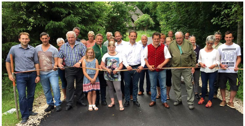
Nach 2 Jahren Bauzeit konnten der Habeschnigweg und der Kuschweg feierlich eröffnet werden