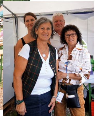
Freundliche Bewirtung im MGV Zelt