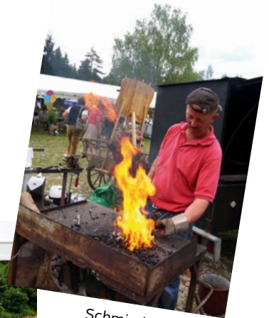
Schmiedekunst von Peter Jäger