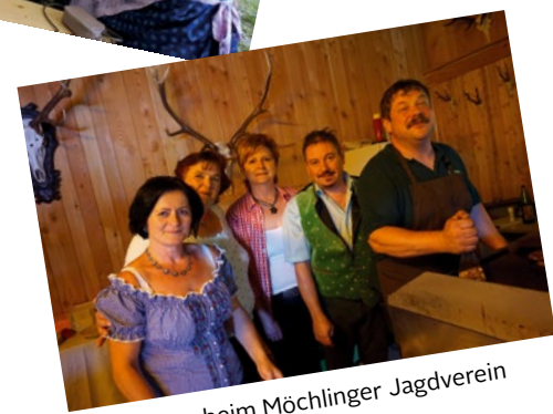
Gute Laune beim Möchlinger Jagdverein