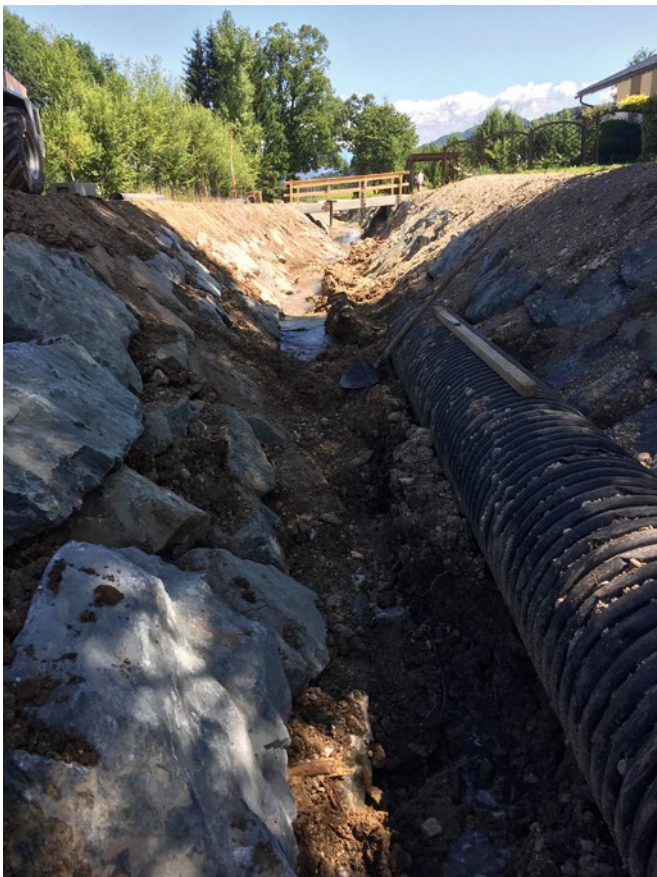
Die Hochwasserschutzmaßnahmen am Abriacherbach gehen zügig voran

Der Sommer ist da und die Urlaubs-, Ferien- und Erntezeit beginnt. Ich hoffe sehr, dass wir, schon wie in der Vergangenheit, vor schlimmen Unwetterschäden verschont bleiben. Damit das auch in Zukunft so bleibt wurde im Frühjahr mit den Verbauungsmaßnahmen beim Abriacher Bach begonnen. Die Arbeiten schreiten gut voran und werden im Herbst dieses Jahres fortgesetzt.