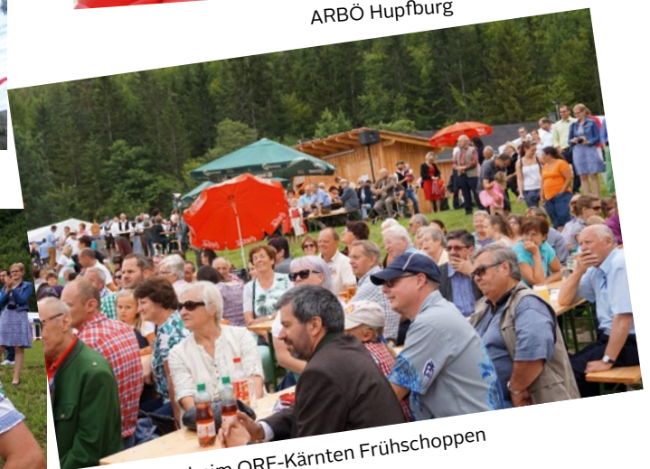
Viele Zuhörer beim ORF-Kärnten Frühschoppen