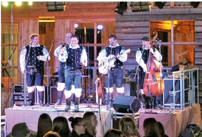
Open Air mit der slowenischen Kultgruppe Modrijani

BESUCHEN SIE DIE GEMEINDE GALLIZIEN AUCH AUF