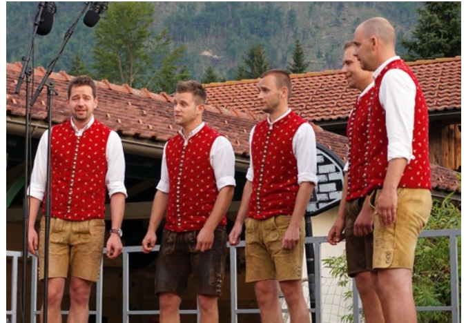
Auch heuer fand wieder das beliebte Kleingruppensingen der Lions statt