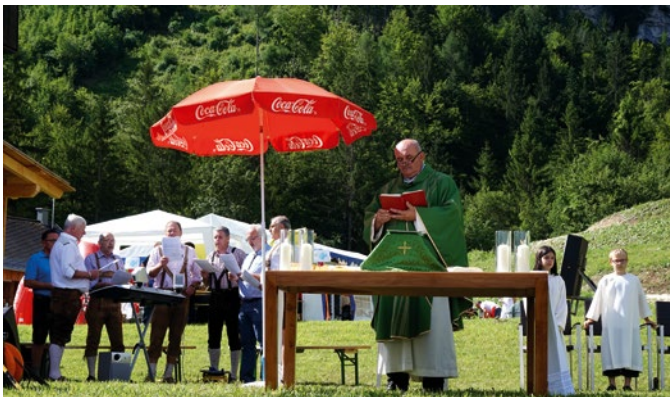
Hl. Messe mit dem MGV