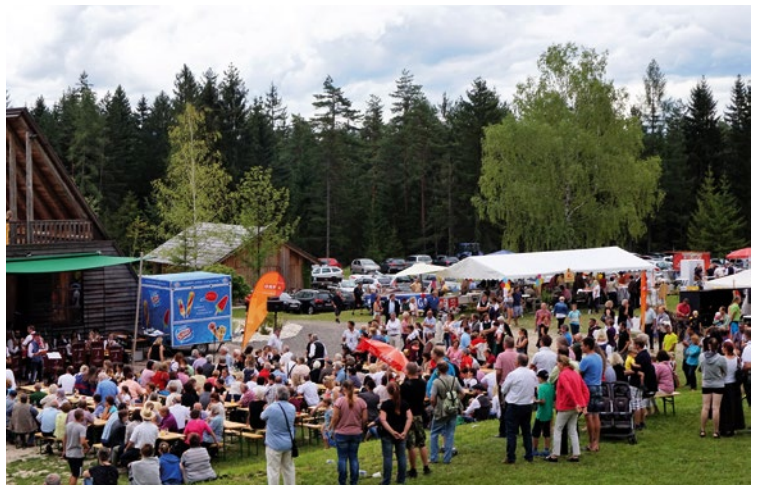
Radio Kärnten Frühschoppen