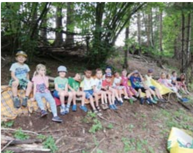
Lagerbau und Ameisenbetrachtung