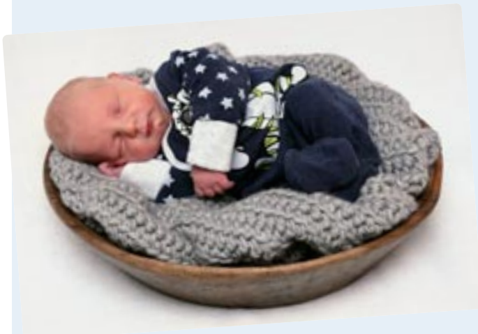
Ben-Luca Konrad Plaßnig