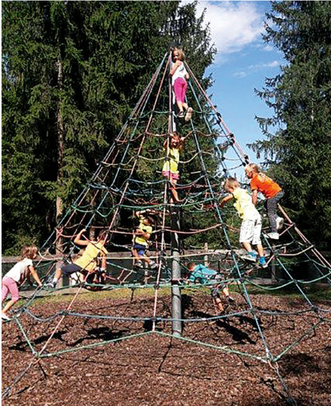
Zum Erlebnis für alle wurde der Ausflug in den Walderlebnispark St. Kanzian.