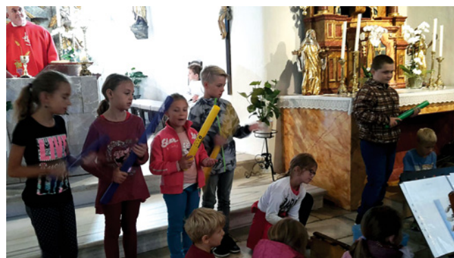
Bilder und Texte: Kotschitsch Rudi, BE

Tudi versko smo začeli novo šolsko leto z šolarsko mašo in si izprosili božji blagoslov.