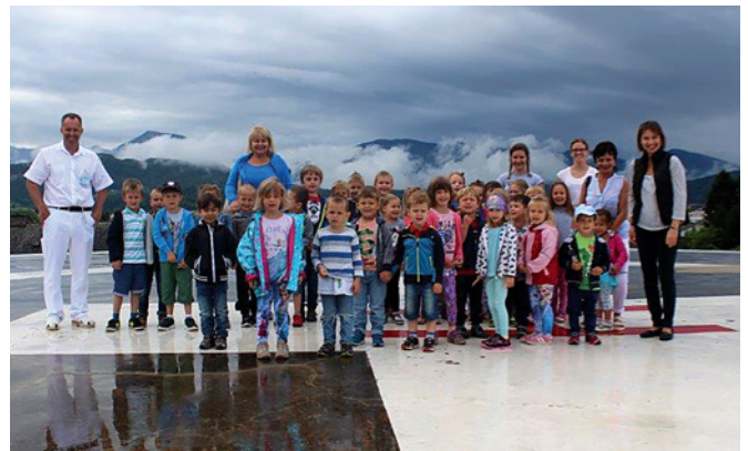
Vom Hubschrauber – Landeplatz bis zum Gipszimmer war alles dabei!