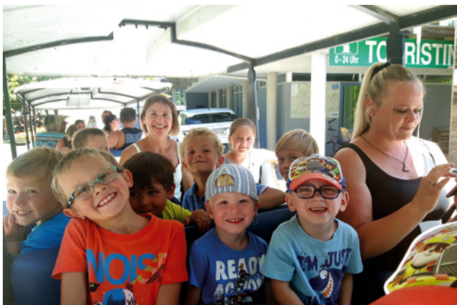
Die Heimreise erfolgte mit dem „Bummelzug“.

Das war für alle Kinder ein echtes Abenteuer!