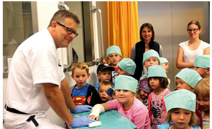
Am Ende gab es für Mutige sogar einen echten Gipsverband!

Zur Stärkung wurden Würstchen und Limo serviert!