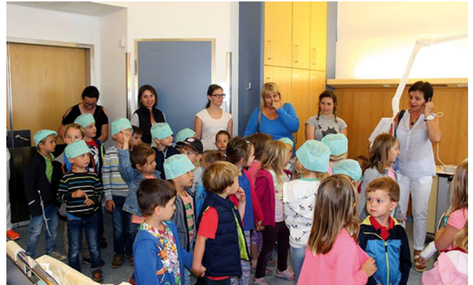
Die Kinder bekamen einen interessanten Einblick vom Alltag im Krankenhaus!