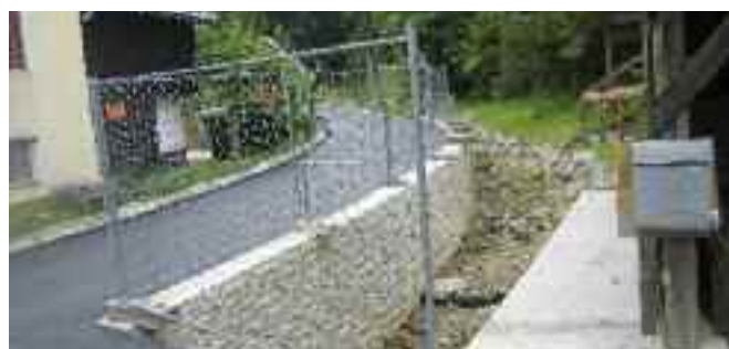
Ausbau vor der Fertigstellung im oberen Ortsbereich von Abriach