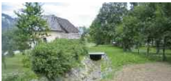
Neuer Gerinneverlauf östlich der Kapelle