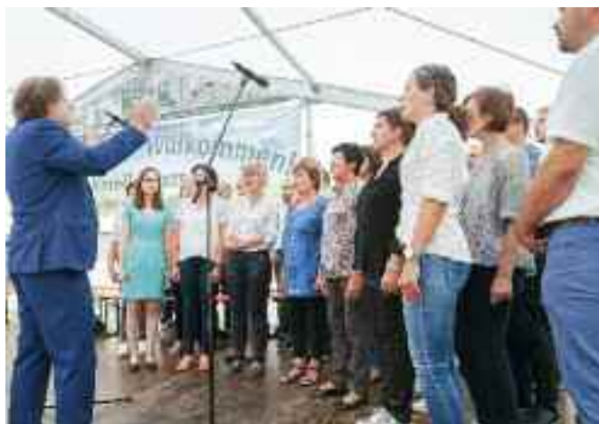
Mešani pevski zbor PD Sele – Gemischter Chor Zell Pfarre