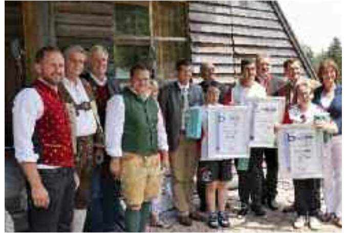
Gruppenfoto mit den Goldmedaillengewinnern