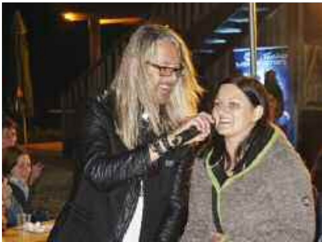
.. Meilenstein Open Air