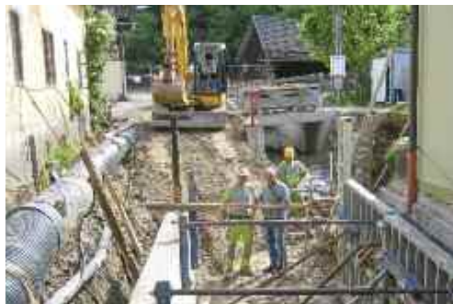
Gerinnebau unter schwierigen Umständen in der Gemeindestraße in Abriach