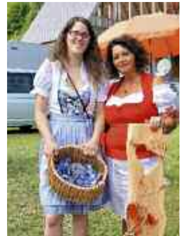
Die freundlichen Willkommensdamen