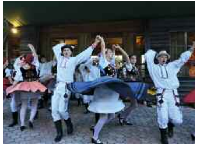
.. Sing-, Tanz- und Musikfestival